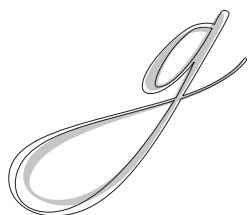
Grau: Zapfino Outline: Zapfino Extra

Die zahlreichen Ligaturen liegen nach wie vor in einem eigenen Schnitt. Auch hier sind neue Paare hinzugekommen genauso wie weitere Variationen zu vorhandenen Ligaturen gezeichnet wurden.