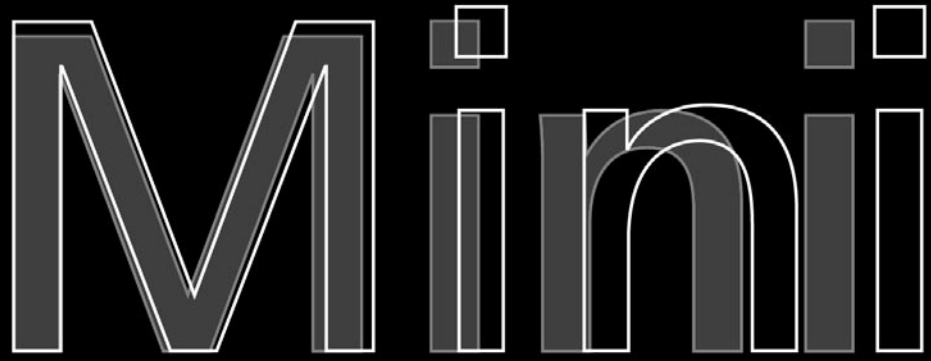
Frutiger 1976 Frutiger 2001

Verkehrte Welt: Der Mini des Jahres 1959 wirkt klein, charaktervoll und leicht (770 Kilo) – der Mini 2001 ist vergleichsweise riesig, geglättet und pummelig (1115 Kilo). Die Frutiger des Jahres 1976 erscheint wie in niedriger Auflösung, detailarm und ausladend – die Frutiger Next zeigt dagegen liebevolle Details und ist gleichzeitig schlank und konzentriert. Unter BMW wurde der Original-Mini stromlinienförmig und aufgeblasen, Sir Issigonis wäre not amused . Ein Beweis für die Zweifelhaftheit von Retrodesign. Linotype Library ist es dank Mitwirkung von Adrian Frutiger gelungen, die Designqualität des Originals noch zu übertreffen – technisch und emotional. Was im Falle des Autovergleichs nicht unbedingt gilt